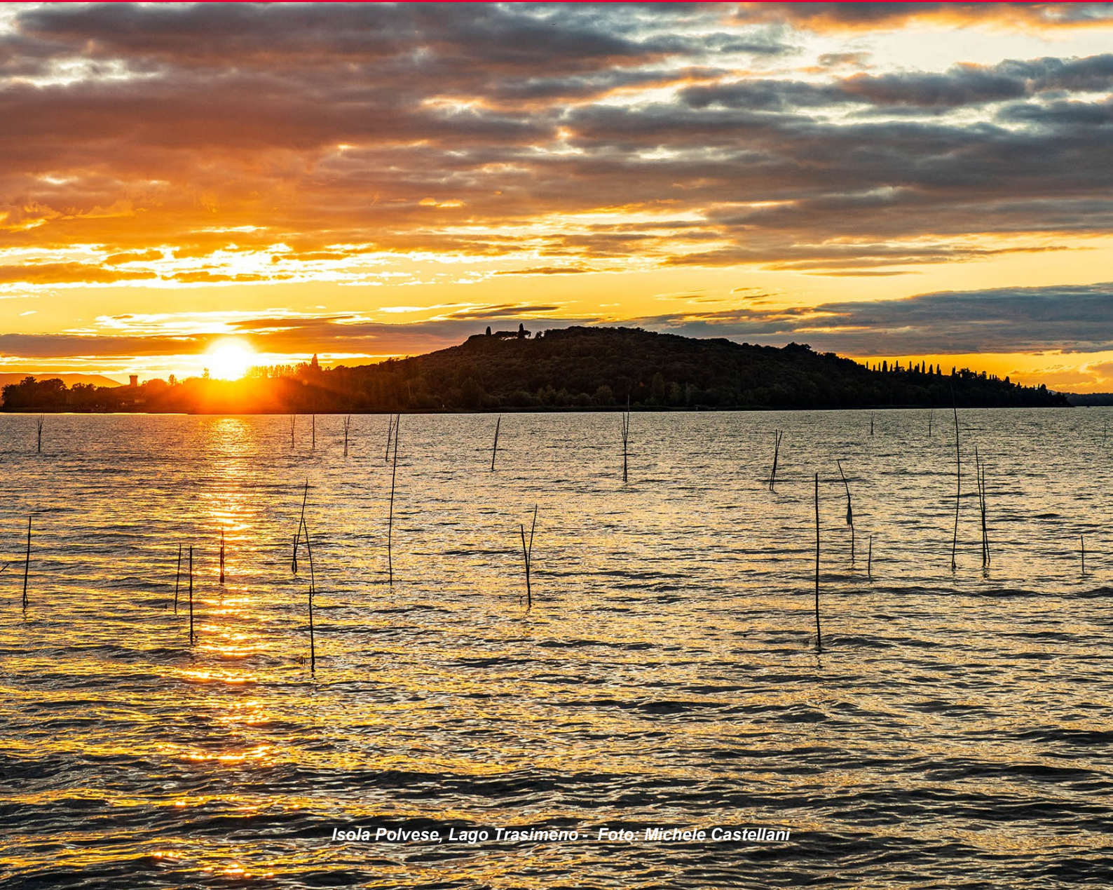
Isola Polvese, Lago Trasimeno